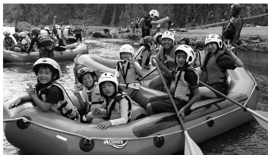
ラフティングをメインに自然体験