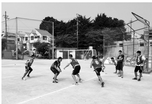
「戦略・戦術」フラッグフットボール