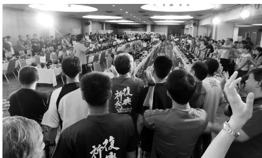
最後はチクサクコールで