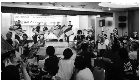
幼年体育分科会の荒馬