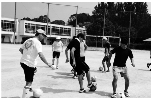
「戦略・戦術」サッカー