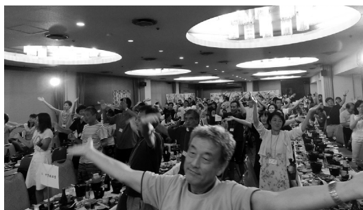
東京支部のおどりにのって