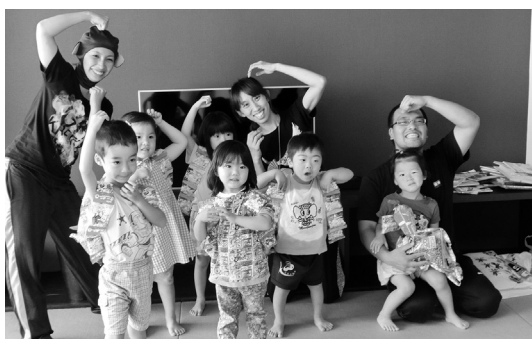
虫とのふれ合いがテーマ