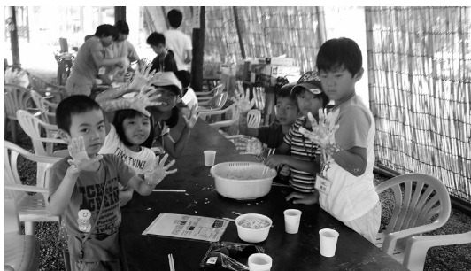
三食とも自炊。大阪粉もん文化を堪能