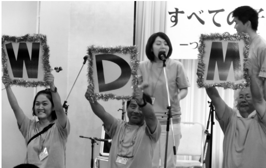
開会行事 キーワードは「W・D・M」 —わかって・できて・学び合う—

暑い、熱い3日間。「わかって、できて、学び合えた」ことでしょうか。研究と交流が深まった足跡の一部を写真で振り返ってみたいと思います。