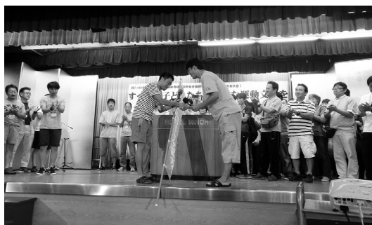
同志会ののぼりは熊本へ引き継がれました