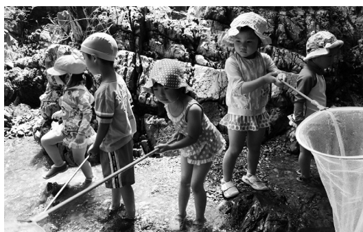
昆虫館に出かけたり、川遊びをしたりしました