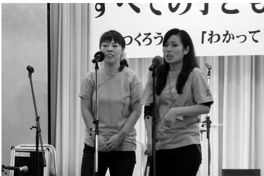
教育情勢を若手漫才でわかりやすく伝えようとした